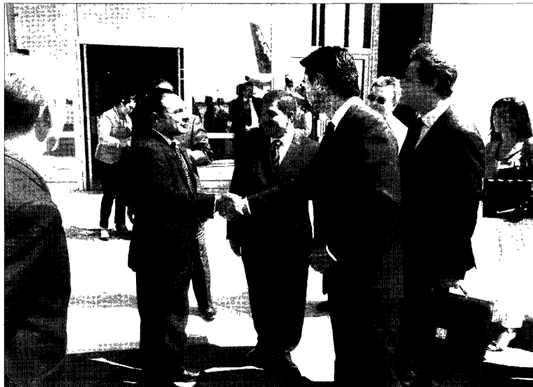
El vicepresidente del Gobierno, José Manuel Soria, a su llegada a Agadir.